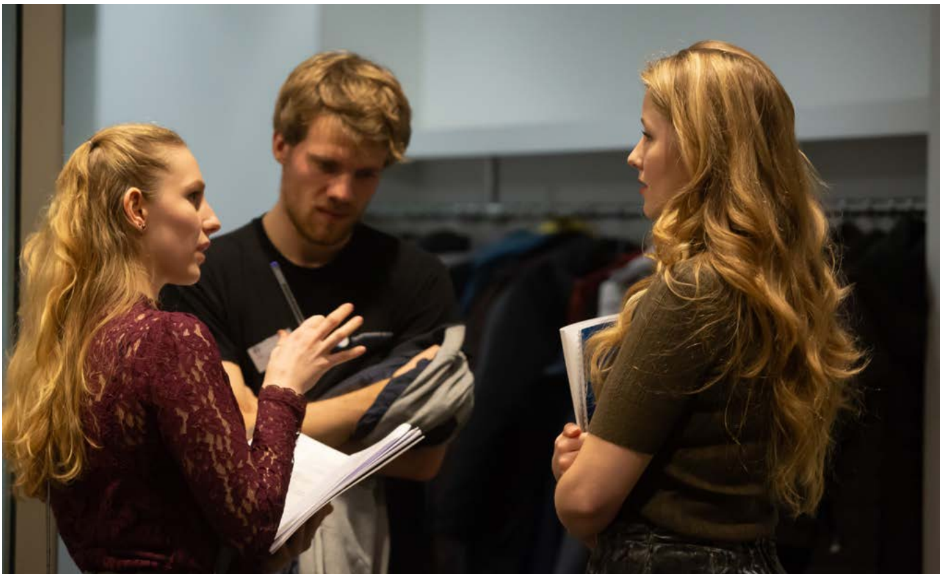
De jongerenjury beraadt zich

Keren de theater- en concertbezoekers die bijna twee jaar lang hun patroon van vrijetijdsbesteding onderbroken hebben terug naar hun oude favoriete plekken of verandert hun gedrag voorgoed?