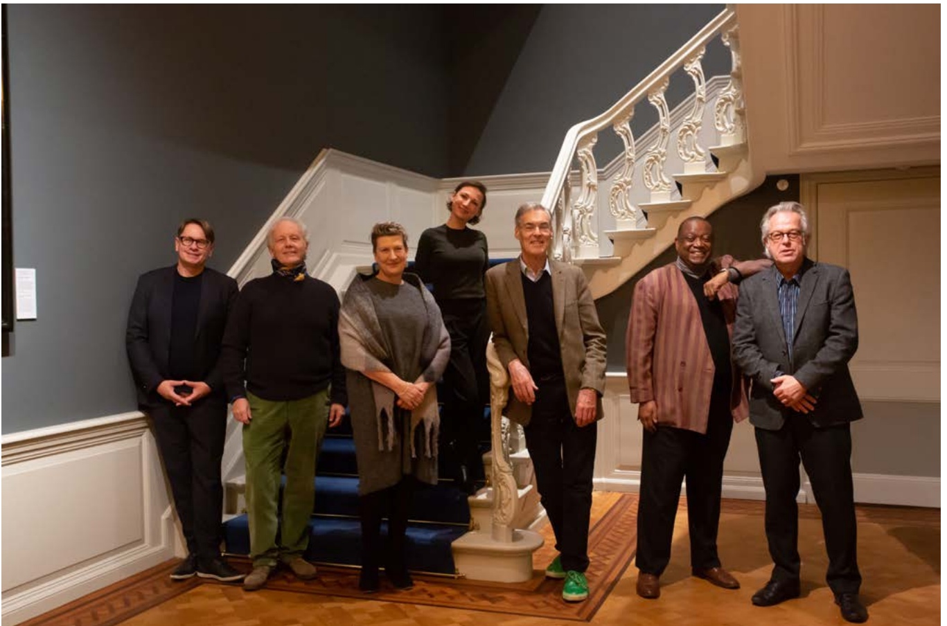
De jury van 2021

De tweede manier waarop wij aan educatie doen is via alle inspanningen om jong zangtalent te helpen ontwikkelen en kennis aan hen over te dragen. (Dit zijn 2 van de drie O's van onze missie: Ontdekken, Ontwikkelen en Overdragen ) Hiervan kon een deel gelukkig wel doorgaan. Uiteraard waren er weer masterclasses met topariesten tijdens de competitieweek. Daarnaast draagt de IVC geregeld bij aan de mogelijkheid voor jonge zangers om 'vlieguren' te maken en gedurende het jaar hun vak op diverse podia te beoefenen tegen een vergoeding die voldoet aan de normen van de Fair Practice Code.