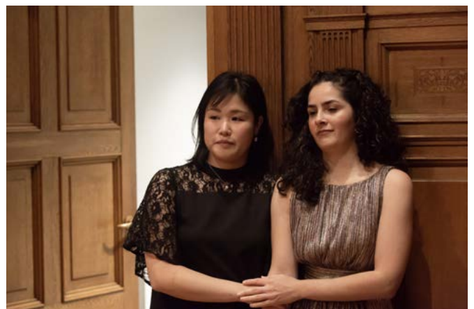
Net voor de opkomst in de halve finale