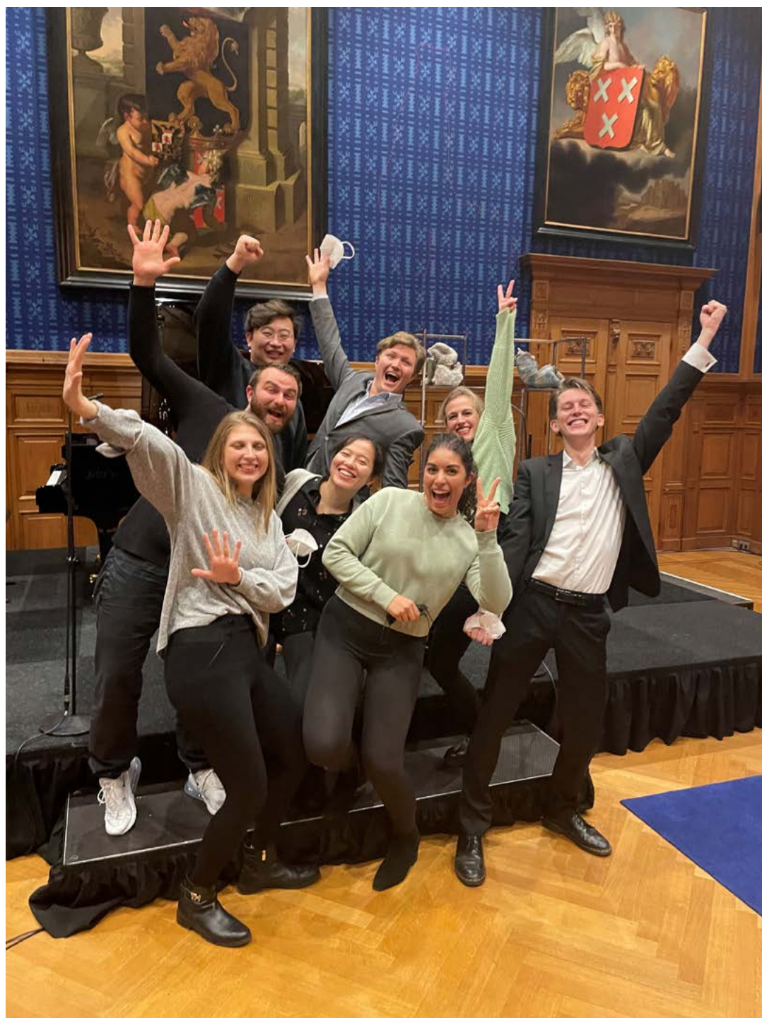
De finalisten van de LiedDuo

www.wfmc.org/news-media/ivc-shertogenbosch-celebrates-its-2021-winners