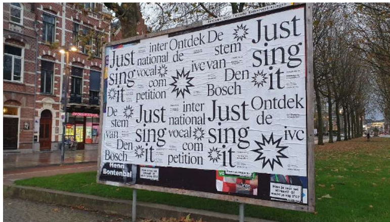
De IVC-naamsbekendheidcampagneposters gericht op de lokale bevolking

Er waren postercampagnes in rond 's-Hertogenbosch, zowel voor de “Art of Singing” masterclass week als voor het concours. Op vele zichtbare locaties in 's-Hertogenbosch wapperden ook dit jaar de IVC- banieren. Het jaar 2023 werd afgesloten met een IVC-naamsbekendheidcampagne met posters gericht op de lokale bevolking, opgezet door een nieuw aangetrokken lokaal grafisch ontwerp bureau Attak.