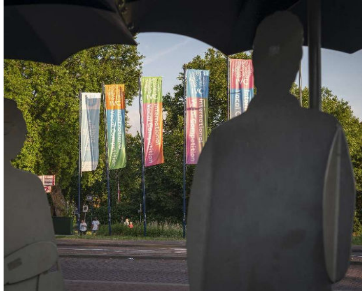
Op vele zichtbare locaties in 's-Hertogenbosch wapperden de IVC-banieren

Er werd voor de Margreet Honig Masterclass week “The Art of Singing” door Margreet Honig zelf een radiospot ingesproken dat via NPO Radio 4 het publiek attendeerde op de masterclass week. En ook voor het concours werd een promotionele radiospot ingesproken. Deze was te beluisteren via NPO Radio 4 STER-reclame en Classic.nl.