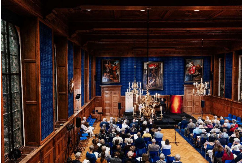
De sfeervolle Blauwe Zaal in het Noordbrabants Museum.

Beide locaties boden wegens het ontbreken van Theater aan de Parade een prachtig alternatief voor het Lied concours. Beide locaties hebben een goede akoestiek en zijn geschikt voor klassieke zang, maar zijn beperkt qua omvang en bieden slechts beperkte ruimte voor publiek. Het Theater aan de Parade heeft vlak na het concours haar deuren weer geopend en we zijn verheugd dat we in 2024 weer in onze thuisbasis terecht kunnen en in kunnen zetten op het ontvangen van meer publiek.